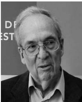
OB a. D. Manfred Rommel