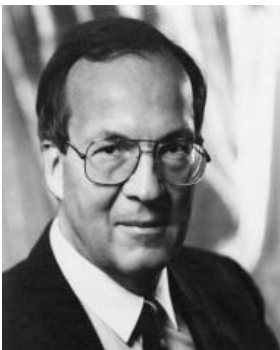
OB Manfred Rommel Stuttgart Januar 1983 - Februar 1989